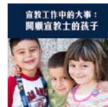
宣教工作中的大事： 四福音士的孩子