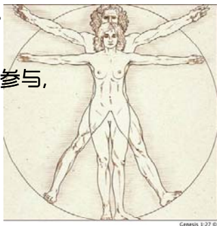
Genesis 1:27 ©

犹太人 讲到创造的时候， 「人要 谦卑 ，为什么呢？因为人比 蟑螂 还晚被受造。」